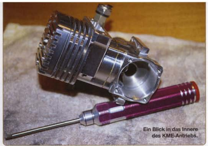
Ein Blick in das Innere des KME-Antriebs.

Block Aluminium, genauer die Aluminiumlegierung, denn reines Aluminium wäre für derlei Anwendungen viel zu weich. Das für den Motorblock verwendete 6061 Aluminium beinhaltet zusätzlich Magnesium und Silizium; dies gibt dem weiterhin leichten Material eine gute Formbarkeit bei gleichzeitiger Korrosionsresistenz und vor allem Härte. Andere Teile des Motors, z. B. Kolben, Pleuel oder Vergaser, sind aus 7075 Aluminium gefertigt. Diese, auf Zink basierende Legierung gilt als eine der besten zur Verfügung stehenden. Dabei werden zur Zeit fast alle Teile des Motors von KME selbst gefertigt. Nur Kolben und Ring stammen von Zulieferern.