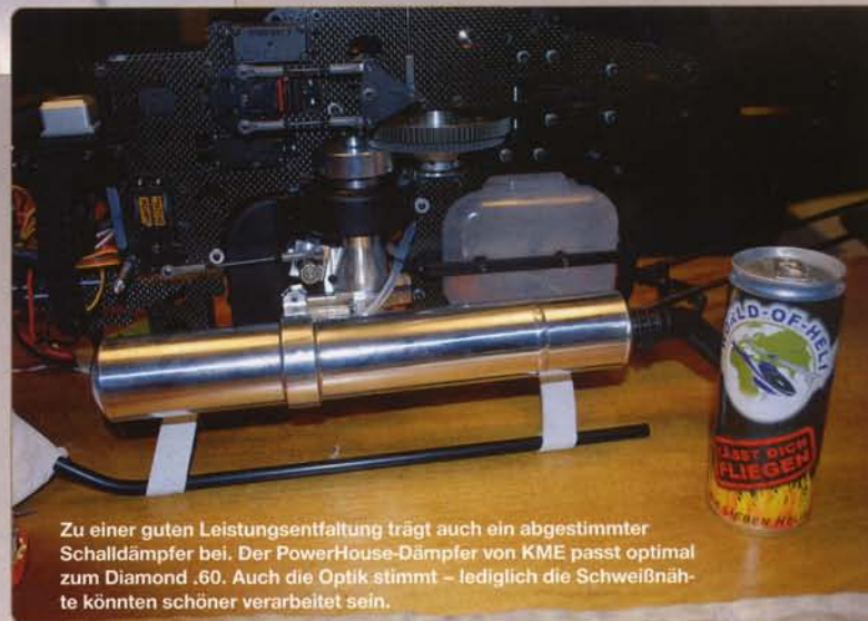
Zu einer guten Leistungsentfaltung trägt auch ein abgestimmter Schalldämpfer bei. Der PowerHouse-Dämpfer von KME passt optimal zum Diamond .60. Auch die Optik stimmt – lediglich die Schweißnähte könnten schöner verarbeitet sein.

Der glänzende Motor steht dem Heli zumindest optisch ganz ausgezeichnet, denn die